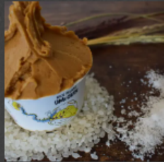
TANGO SIO CARAMEL ¥580