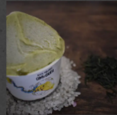
GREEN TEA (新茶) ¥600