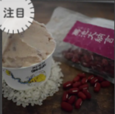
OSEKIHAN ~KOMOIKE ~ ¥800