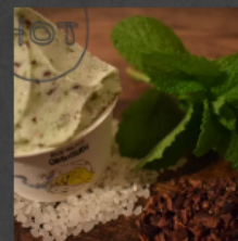
CHOCO Mint a.k.a. KANABO CHOCOLATE ¥750